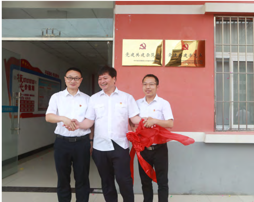
2020年12月11日，株机公司牵头浦镇公司与长春车辆段设立了首个党建共建大师创新工作室。