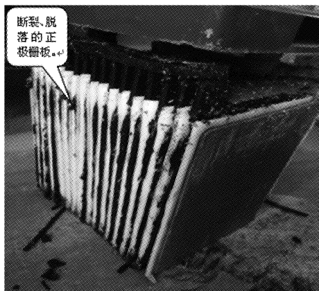
图3 铅栅局部断路的正极板

蓄电池体温度升高,在充电过程中因电解液缺少导致温度容易升高,周而复始的恶性循环的结果,将直接导致蓄电池极板物质膨胀形成壳体“鼓包”,甚至裂损现象(如图3所示),使蓄电池寿命终结。